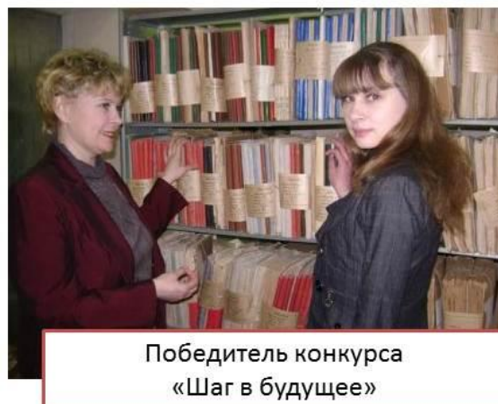
Победитель конкурса «Шаг в будущее»