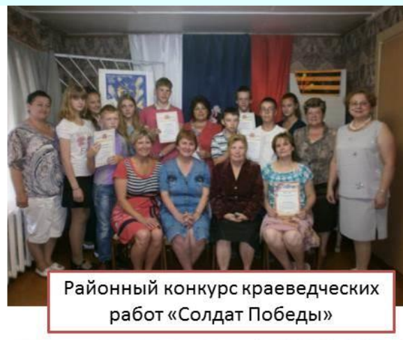
Районный конкурс краеведческих работ «Солдат Победы»