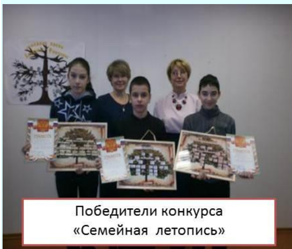
Победители конкурса «Семейная летопись»

взаимодействие с отделением Пенсионного фонда Российской Федерации по Костромской области.